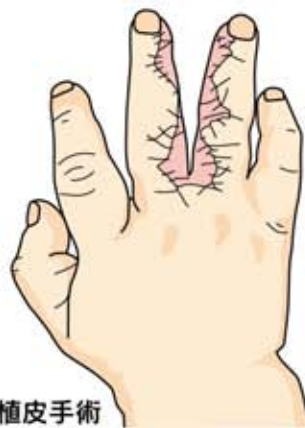
指間部への植皮手術