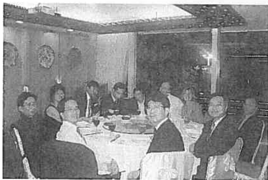
Welcoming Dinner にて