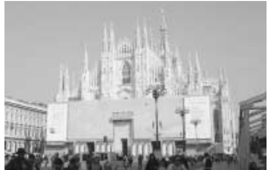
会場近くの Duomo (改修中)